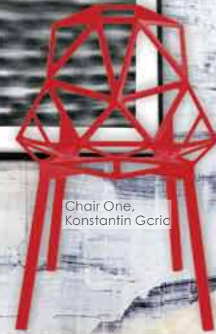
Chair One, Konstantin Grcic

La garde-robe lingerie en pleine reconstruction. Perfection visuelle et super confort font indissociable allure. Les nouvelles matières stretch s'étoffent de qualités cosmétiques et de textures intéressantes au toucher comme en effets de surfaces. Les jauges fines et légères demeurent la clef de la modernité, suivies par les matières compactes avec effet, et le retour des mailles brillantes douces au toucher.