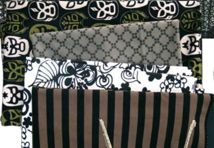
Eusebio, Liebaert, Billon Crealy's

Eclats et batiks, ultra graphique, dentelles de createurs. ikat & rhytm, more than geometric, designer's laces.